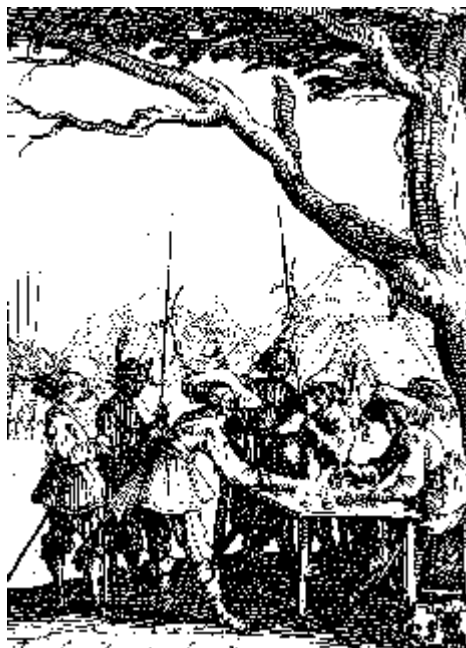
Lejesoldater får udbetalt løn under Trediveårskrigen. Efter kobberstik af J. Callot.

Denne ceremoni er fortsat op til slutningen af 1800-tallet. Rektor skulle ifølge sin edsaflæggelse være sin biskop, sin provst og sin præst lydige. Og han kunne håbe at blive forfremmet til præst, provst eller biskop. Blandt andet derfor havde skolen 25 rektorer i tiden mellem 1536 og 1660 eller en gennemsnitlig embedsperiode for en rektor på 5 år. Elevtallet ved skolen svingede meget i denne periode. I 1542 var der 40 elever. I 1591 mellem 250 og 260 elever, og i 1592 315 elever. Vi kender fordelingen på klasser dette år. 1. lektie 108 elever, 2. lektie 47, 3. lektie 43, 4. lektie 37, 5. lektie 34 og 6. og øverste lektie havde 46 elever. Derfra kunne man gå videre til universitetet. Københavns Universitets matrikel viser, at der i perioden 1611-60 er optaget 323 studenter fra Ribe. Også ved udenlandske universiteter blev Ribes studenter optaget, først og fremmest i Wittenberg, men også i Rostock.