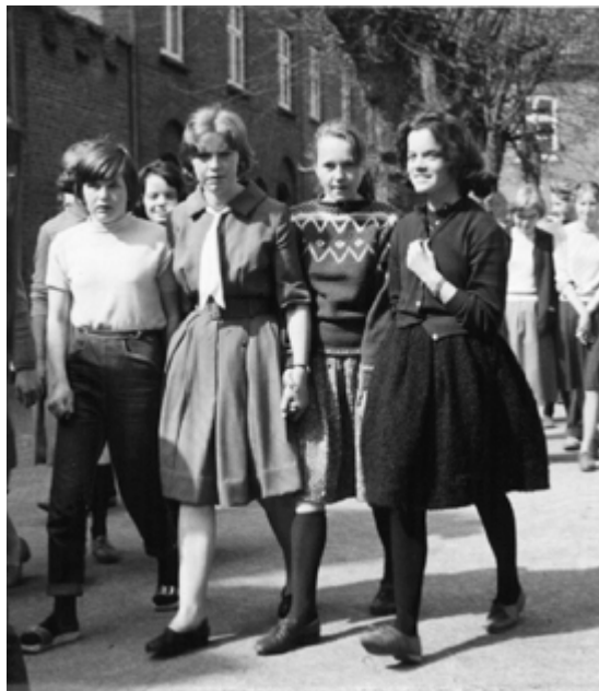
Frikvarter i slutningen af 1950'erne.

1903-reformens 3 linier slog først igennem senere på skolen. De første klassisk-sproglige og matematiske studenter efter 1903-ordningen dimitteredes i 1910. De første nysproglige studenter fik