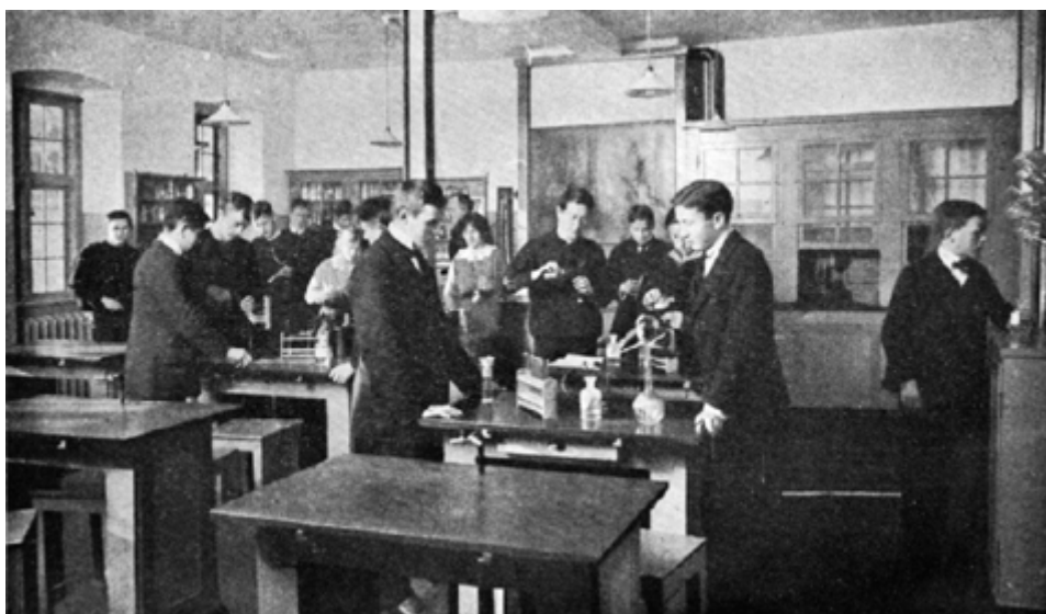
Kemilokalet i Puggård, 1915.

Dette ændredes med skolereformen af 1903. Den skabte ét sammenhængende skolesystem fra grundskolens 1. klasse til studentereksamen. Efter 5 år i grundskolen kunne de elever, der bestod en optagelsesprøve, komme i en 4-årig mellemskole. Derfra var der adgang til et 3-årigt gymnasium eller en 1-årig realklasse. Gymnasiet bestod herefter af 3 linier: den klassisk-sproglige, den nysproglige og den matematisk-fysiske linie, hvor latin gled ud til fordel for flere timer i moderne sprog. Resultatet var en styrkelse af dansk og moderne fremmedsprog. Loven gav også piger adgang til statens gymnasieskoler. Den sidste reform tilsluttede den nyindsatte rektor Øllgaard sig på Ribe Katedralskole ikke uden lidt betænkelighed.