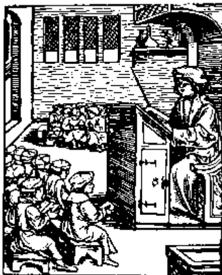
Latinskole i 1500-tallet.

Kirkeordinansen havde også præcise bestemmelser om, hvad der skulle læses i hver lektie (klasse). På skemaet i sidste lektie - skolemesterens egen lektie - stod der latinsk stil, latinsk grammatik, sang, religion og begyndelsesgrundlag i græsk.