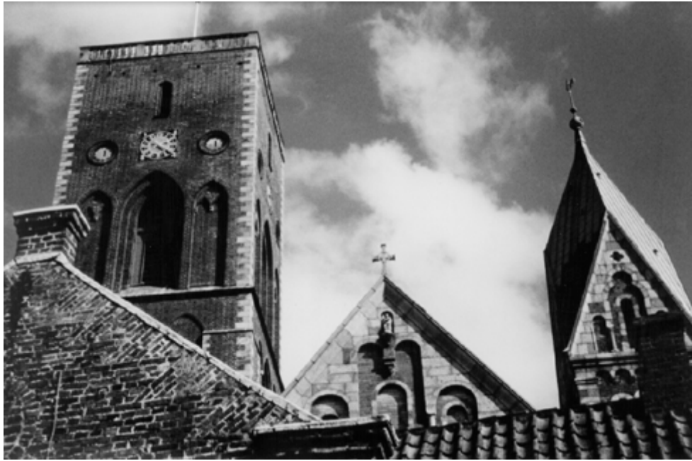
Domkirken set fra Falsters skolegård, september 1994.

Humanist er i virkeligheden den betegnelse der passer allerbedst på Falster. Hans humanisme var i slægt med Erasmus af Rotterdams; hans studerekammer var fyldt med klassiske værker. Ingen engelske og franske! Hans fag - for det var virkelig et fag for ham - filologien forsatte ham til en anden verden, den græsk-romerske. Når han trak sig tilbage til sit Musæum , sit studerekammer, kunne han ånde frit, tænke frit, være en fri mand. Faget filologi definerer han som en "egen metode, en smag og ynde i videnskaben" - og det som faget skulle tjene: videnskaben, den humanistiske, er for ham en metode i livet, en livssag; humanitas er også humanitet. "Ingenui nati sumus honestam libertatem a natura dotem vitæ nacti" - 'Vi er født frie og har fået en ærlig frihed som livsarv af naturen' - det siger han i en diskussion med en præst, der glæder sig over at det er lykkedes den pietistiske bevægelse at få bugt med dans og kortspil. Falster deler ikke den glæde: "når andre danser med fødderne, danser jeg med øjnene", siger han; " Gud har ikke sat os dødelige i dette liv som i en trædemølle, for at vi skal skamme os over os selv" - og så følger citatet ovenfor.